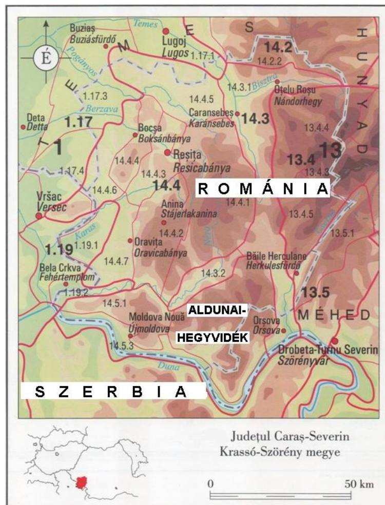
1. ábra. Az Aldunai-hegyvidék és térségének földrajzi helyzete

A történeti Temesi Bánságot (korábbi nevén Temesköz) a Duna, Tisza, Maros és a Déli-Kárpátokhoz tartozó Retyezát hegytömeg határolja. Keleti-délkeleti részét a Bánsági-hegyvidék alkotja, melynek déli részét képező Aldunai-hegyvidéket északon a Néra folyó által átszelt Almás-medence, keleten a Cserna-völgye, délen az Aldunai-szoros határolja. Az 1224 m-es hegységet völgyek, medencék tagolják, szubmediterrán hatású éghajlat és élővilág jellemzi [1]. Lombhullató erdőinek kitermelése évszázadokkal korábban elkezdődött, a hagyományos gazdasági tevékenységek a fakitermelés, a szénégetés és a juh, illetve szarvasmarha tenyésztés.