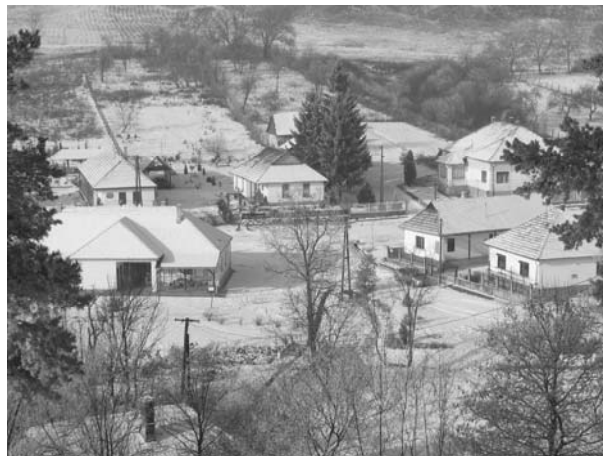
A falusi turizmus fogadó épületei Irotán