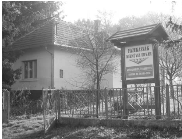
A zselicai falusi bemutató porták egyike Bánya településen