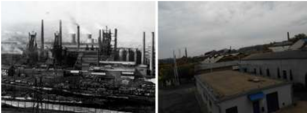
1. ábra: LKM a múltban és napjainkban

Diósgyőrben a nehézipar csaknem 140 évre tekint vissza, amikor a háromi vasmű erre a területre költözött, ám valódi virágkorát a második világháború után élte, a szocialista erőteljes iparosításnak „köszönhetően”, 1948 után sorra érkeztek a Szovjetunióból a kohászathoz szükséges, hiányzó nyersanyagok. Az 1950-es évek után pedig a nehézipari termelés majdnem a két és félszeresére nőtt (Czomba 2008), valamint erőtejesen emelkedett az iparban (elsősorban a nehéziparban) foglalkoztatottak száma a megyében. Borsod-Abaúj-Zemplén megye Budapest és Pest megye után az ország második legnagyobb ipari foglalkoztatással jellemezhető térségévé lépett elő. Ma a legtöbb vasgyári telepen élő családban már a nagyapák is valahol a diósgyőri gyárakban egyikében (LKM, DIGÉP) dolgoztak. Nemcsak interjúalanyom, hanem a szülei is az LKM területén dolgoztak. „... .. édesapám és édesanyám is az LKM-ben dolgoztak. A gyár környékére építettek szolgálati lakásokat, ezt a gyári munkások kapták meg. Itt lakhattak.(...) Édesapám művezetőként dolgozott, 3 műszakban. 5 vagy 6 éves lehettem, amikor egy nagy robbanás volt a gyár területén, ő pont akkor dolgozott és ő is meghalt a robbanásban...”