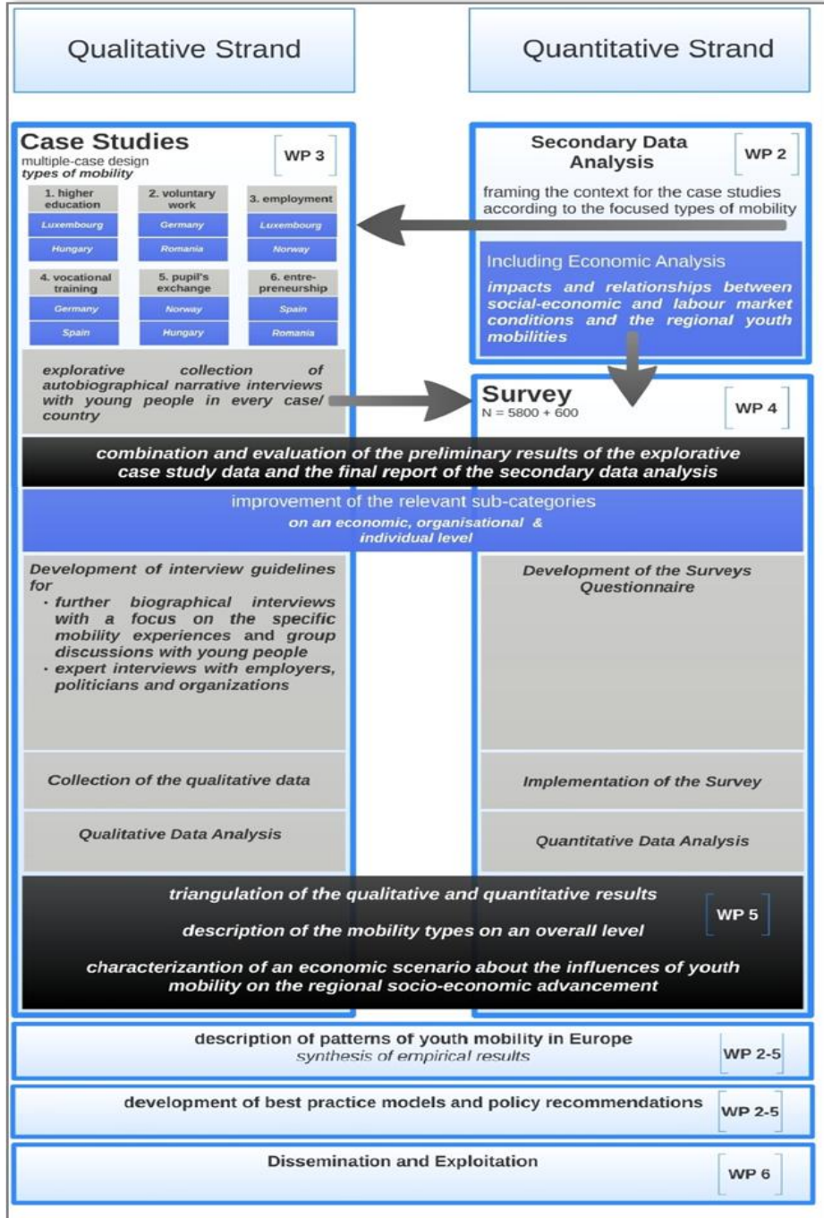
4. ábra: A MOVE kutatási tervének felépítése

A MOVE projekt általános törekvése, hogy kutatási eredményeivel hozzájáruljon a fiatalok mobilitásának javításához, csökkentse a vándorlás negatív hatásait. A mobilitás jó gyakorlatainak meghatározásával erősítve a fenntartható fejlődést és a jólétet.